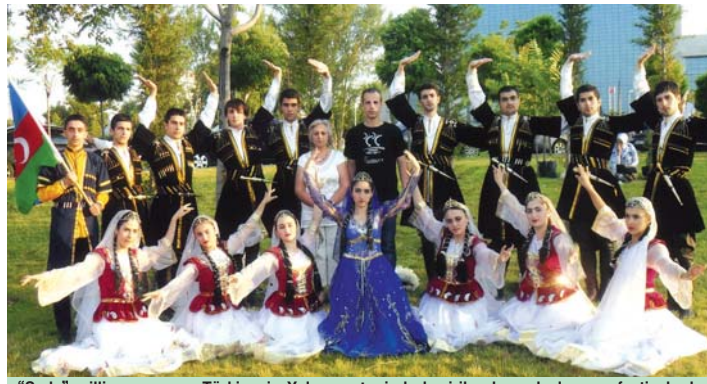
"Səda" milli rəqs qrupu Türkiyənin Yalova şəhərində keçirilən beynəlxalq rəqs festivalında