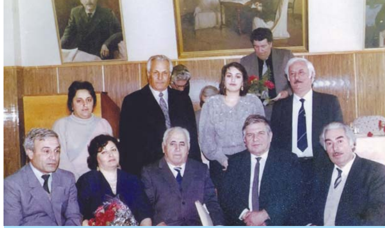
Fakültə əməkdaşları ilə