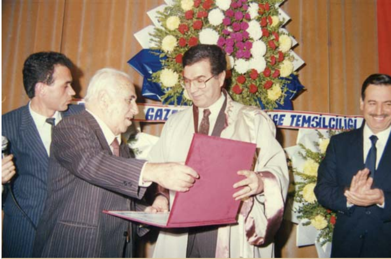
Konya Səlcuq Universitetinin Fəxri doktoru adı verilən zaman