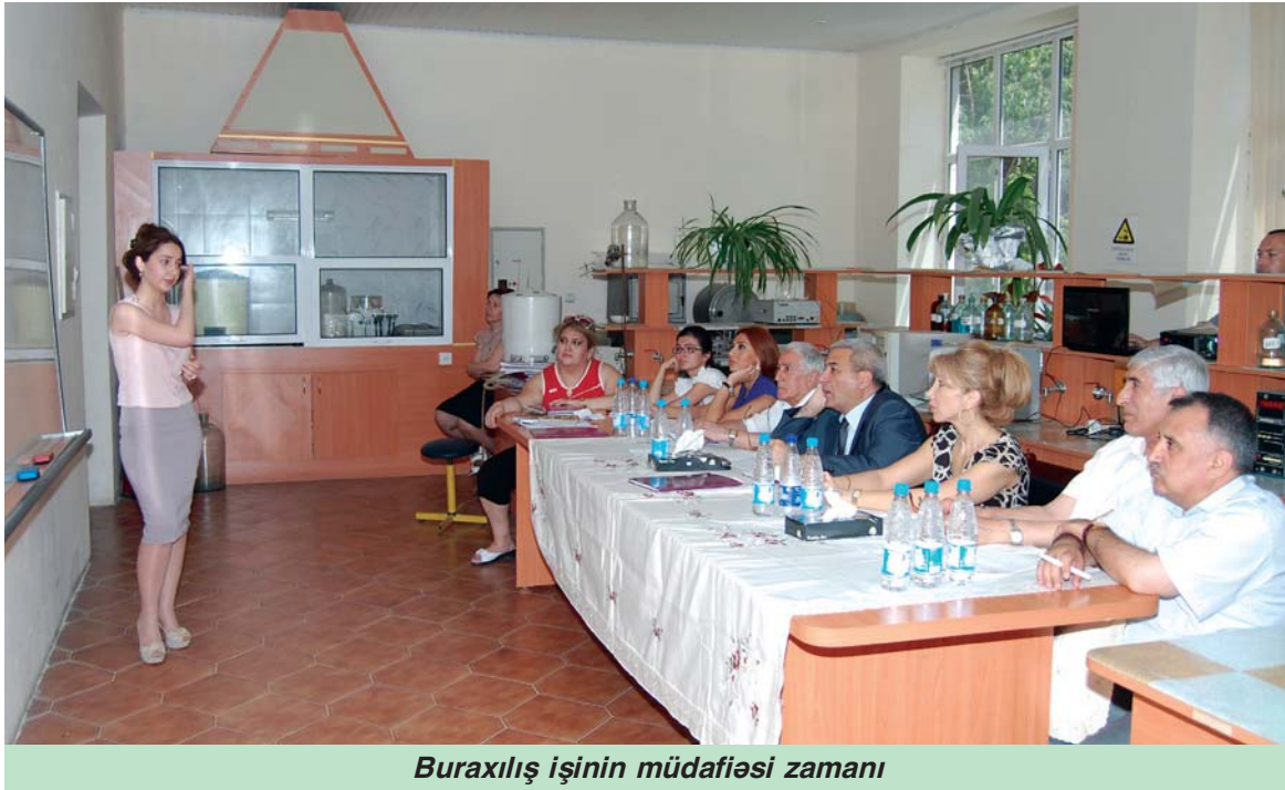
Buraxılış işinin müdafiəsi zamanı