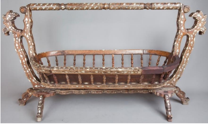
Şək. 2. Beşik

№2682] Azərbaycanda ağacişləmə sənətinin XVIII əsrin ortalarına aid ən gözəl nümunələrindən sayıla bilər. Altı ədəd yonma üsulu ilə hazırlanmış ayaqlar üzərində dayanan beşiyin yatacaq hissəsi oval formalı olub, üst hissəsi ona millər vasitəsilə birləşdirilmişdir. Beşiyi yatacaq hissəyə dirək vasitəsilə birləşdirən dəstəyi isə oturacağa dayanmış və baş hissəsi fiqurlu elementə bərkidilmişdir. Yüksək sənətkarlıqla hazırlanmış beşiyin üzərinə qaxma üsulu ilə sədəf, metal tel və fil sümüyündən naxışlar bərkidilmişdir. Bu naxışlar ürək, yarpaq və üçguşə formalıdır.