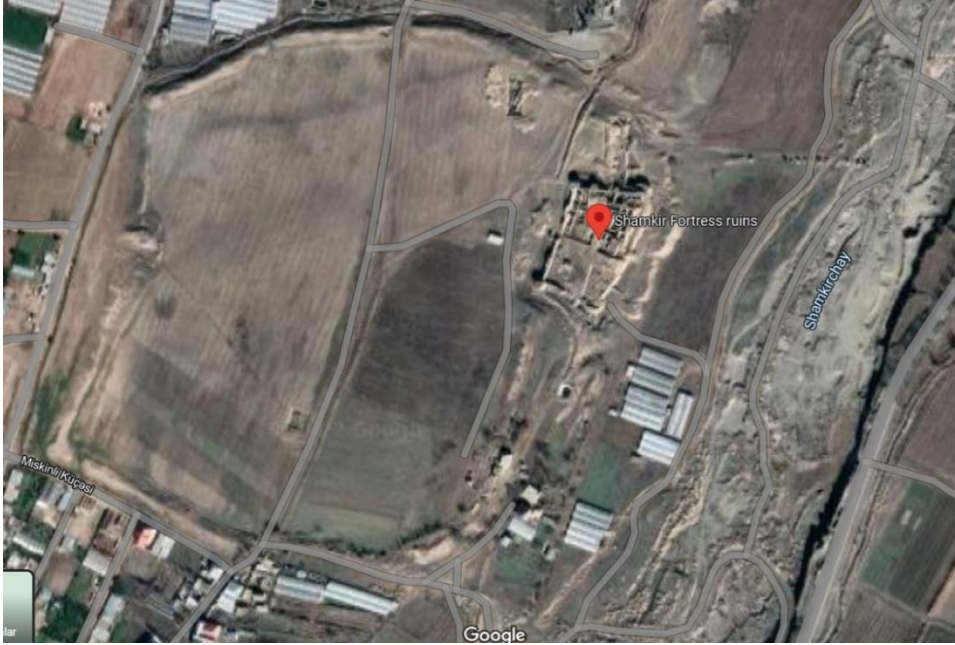
Şək. 1. Şəmkir şəhər yerinin peykdən çəkilişi (Google Earth)