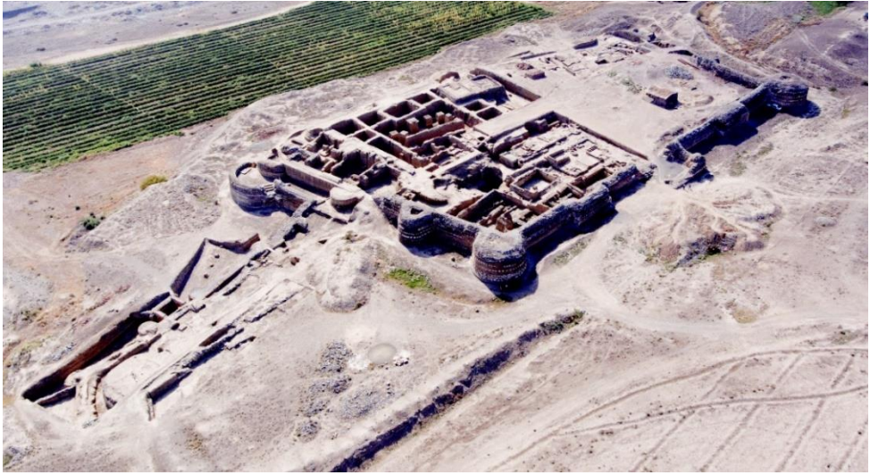
Şək. 2. Şəmkir şəhər yeri. Narınqala və şəhərə girişdəki arxeoloji qazıntı sahələrinin fəzadan görünüşü (avqust 2022-ci il)

Oxşar genişmiqyaslı arxeoloji qazıntılar XXI əsrin ilk onilliklərində Şəmkir şəhər yerində aparılıb. Şəhər yerinin narınqala və şəhristan sahələrində aparılan arxeoloji qazıntılar ümumiliklə 1 hektardan artıq ərazini əhatə