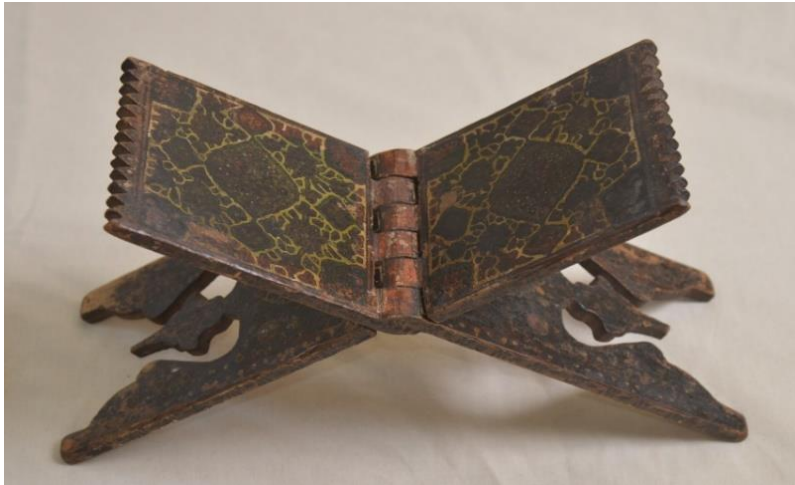
Şək. 3. Rəhil

Etnoqrafiya fondunda qorunan ağac məmulatları arasında rəhillər də xüsusi yer tutur. Keçmişdə, əsasən, mədrəsə və mollaxanalarda “Quran” və