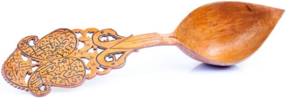
Şək. 1. Şərbət qaşığı

Etnoqrafiya fondunda ağac məmulatları kolleksiyasına aid bəzi nümunələr öz zərif işlənməsi və bədii tərtibatına görə Muzeyin inciləri sırasındadır. Onların arasında şərbət qaşıqları xüsusi yer tutur. İkiüzlü oyma üsulu ilə bəzədilən belə qaşıqların sapı üzərində onun təyinatına uyğun olaraq dini məzmunlu kalliqrafik yazılar həkk olunurdu. Bu qaşıqlarla keçmişdə dini mərasimlərdə şərbətxordan təbərrük suyu götürmək üçün istifadə edilirdi. Məhərrəmlik mərasimində icra edilən belə bir adət var idi ki, məclisə daxil olan şəxs xüsusi hazırlanmış şərbət suyundan təbərrük kimi içərdi. İnanca görə, belə bir təbərrük suyunu içmək savab hesab edilirdi [11, 12-13].